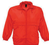
1918200 Regenjacke „solo“, in L und XL lieferbar vorher 12,-00 - jetzt 8,00