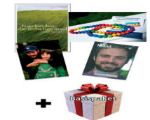
1918498 Politisch-literarisch- filmisches Weihnachtspaket, statt 74,99 für nur noch 31,00