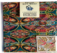
1918466 Geschenkpapier, versch. Motive 3,45