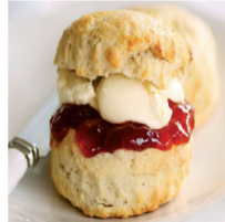
210003 White Scones, 450g, vorher 3,-99 - jetzt 2,50