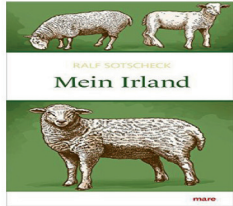
1918543 R. Sotscheck: Mein Irland, 16S, gebunden 18,90