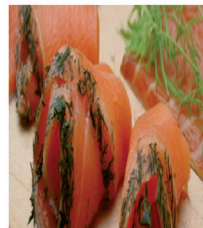
2150001 Clare Island Öko-Lachs, 500g 39,00