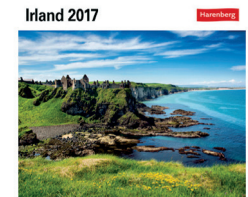
1918546 Sehnsuchtskalender 2017, 16x17,5cm 15,99