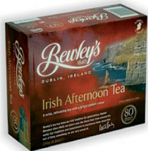
1918170 Bewleys Irish Afternoon Tea, 80Beutel 5,98