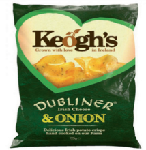
1918359 Keogh's Crisps Cheese&Onion, 2x50g 2,50