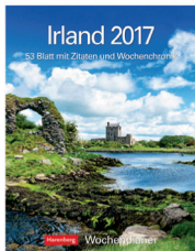
1918547 Wochenplaner 2017, 25x35,5cm 15,99