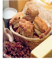
210004 Brown Scones, 450g, vorher 3,-99 - jetzt 2,50