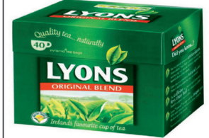
1918302 Lyons Original Blend, 40Beutel 3,95