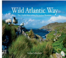
1918445 S. Schnebelt's Bildband WAW, 300S. 59,95