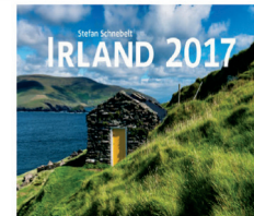
1911078 Irland Kalender 2017 - S. Schnebelt, 58x39cm 29,90