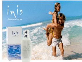
1918286 Inis - The Energy Of The Sea, Unisex, 50ml 29,90