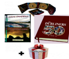
1918497 Musikalisches Geburtstagspaket, statt 72,-89 für nur noch 33,33