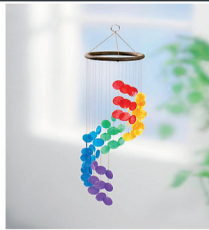
1918463 Regenbogen Windspiel, 65cm lang 11,90