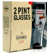
1243012 2 Guinness Flying Toucan Pints 7,90