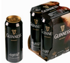
1249003 Guinness 4er Pack 8,95