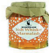
1918358 Irish Whiskey Marmelade, 110g 1,90