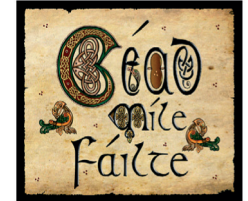
1918310 Metallschild „Cead Mile Failte“, 40x30cm 11,80