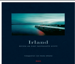
1444001 mare-Bildband: Irland, 136Seiten, 25x33cm 49,00