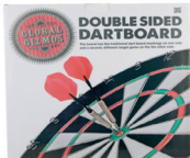
1918304 Doppels. Dartboard, 1x trad. Dartb., 1x Ringzielscheibe, 6Pfeile 18,75