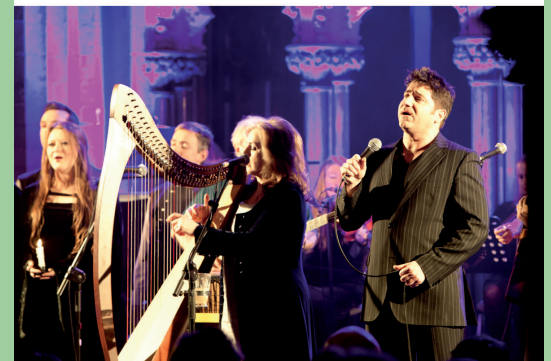
... TradFesten und anderen Musikreisen mit dem EBZ Irland.